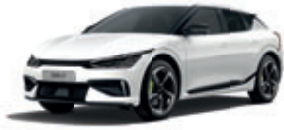
Snow White Pearl (perleťový lak)