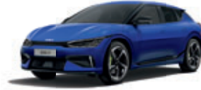
Yacht Blue (metalický lak)