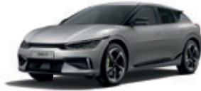
Moonscape (matný lak)