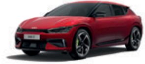
Runway Red (metalický lak bez príplatku)