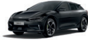
Aurora Black Pearl (metalický lak)