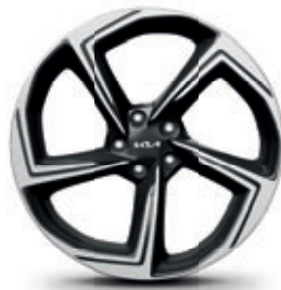
21-palcové disky kolies z ľahkých zliatin (pneumatiky 255/40 R21)