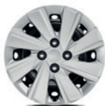
15-palcové oceľové disky kolies s okrasnými plastovými krytmi (pneumatiky 185/65 R15) Silver