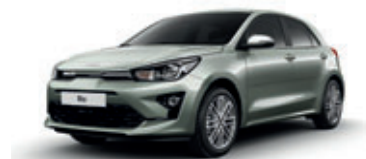
Urban Green (metalický lak)