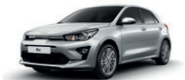
Silky Silver (metalický lak)