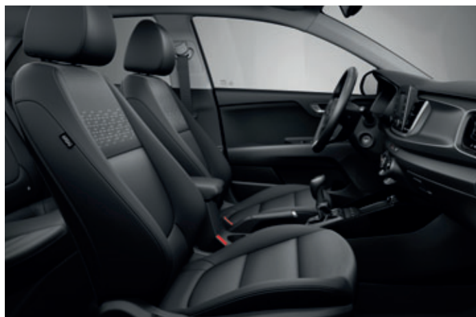
Látkové čalúnenie sedadiel (Gold)