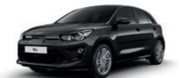
Aurora Black Pearl (perleťový lak)