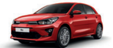
Signal Red (metalický lak)