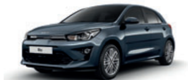
Smoke Blue (metalický lak)