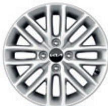
15-palcové disky kolies z ľahkých zliatin (pneumatiky 185/65 R15) Extra / Gold