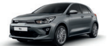
Perennial Gray (metalický lak)