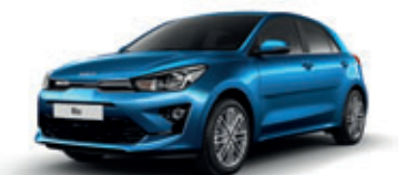
Sporty Blue (metalický lak)