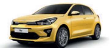
Most Yellow (perleťový lak)